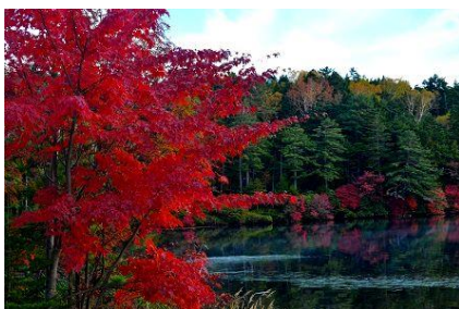
紅葉まっさかり 白駒池 10月