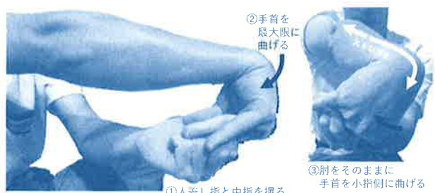
図2 短橈側手根伸筋のストレッチ

装具療法は、テニスバンドです。市販品が購入しやすく、使用による有害事象の報告はありません。試した効果で着用を判断します。